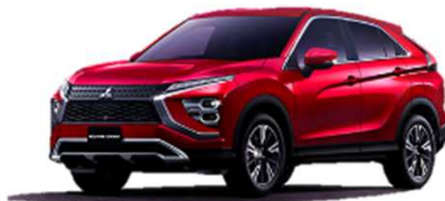
エクリプスクロス