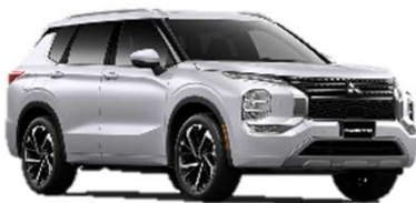
アウトランダー 海外のみ販売中