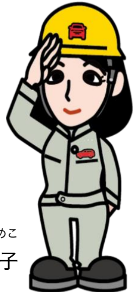
みつびし ひめこ 三菱 姫子