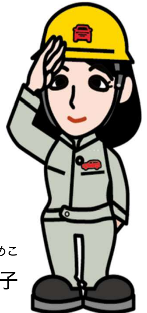
みつびし ひめこ 三菱 姫子