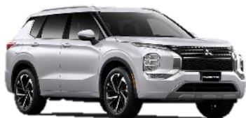
アウトランダー 海外のみ販売中