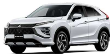
エクリプス クロス PHEV