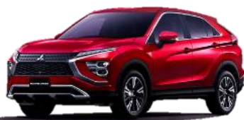
エクリプスクロス