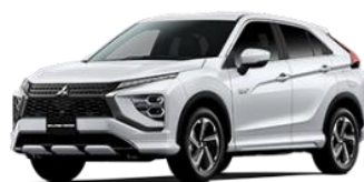
エクリプス クロス PHEV