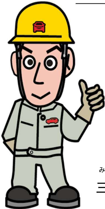
みつびし 三菱 ジロウ