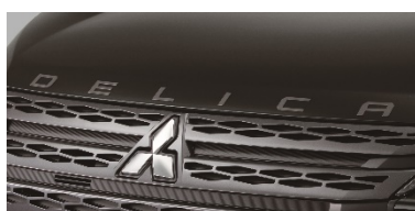
① エンジンフードエンブレム (マットグレー)