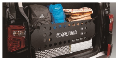
③ カーゴフェンス (JASPER ロゴ入り)