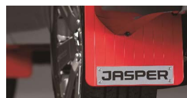
② マッドフラップ (レッド、JASPER ロゴ入りメタルプレート付)