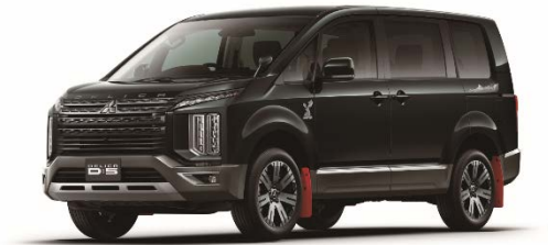
デリカ D:5「JASPER」 JASPER コンプリートパッケージ (ディーラーオプション) 装着車

三菱自動車工業株式会社（本社：東京都港区、代表執行役 CEO：加藤 隆雄、以下三菱自動車）は、オールラウンドミニバン『デリカ D:5』に、アウトドアを楽しむ特別仕様車「JASPER (ジャスパー)」を設定し、4月16日（木）から全国の系列販売会社で販売を開始します。メーカー希望小売価格は4,100,800円（消費税10%込）。