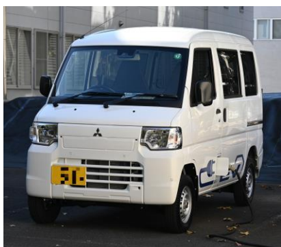
三菱自動車 軽商用 EV 『ミニキャブ EV』