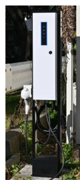
日東工業 Mode3 普通充電器 『Pit-2G』