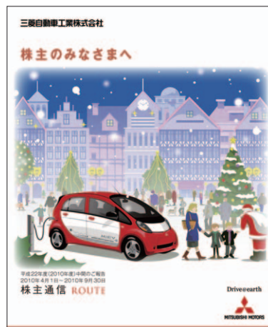
2010年12月発行 「株主通信 ROUTE (ルート)」

「株主通信 ROUTE (ルート)」を2010年6月および12月に発行しました。当社の業績、企業活動、計画についての分かりやすい説明、また商品情報など個人株主様にとって有益な情報掲載を心掛けています。2011年も年2回発行する計画です。