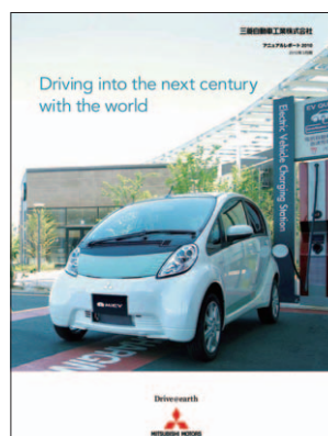
「アニュアルレポート2010」